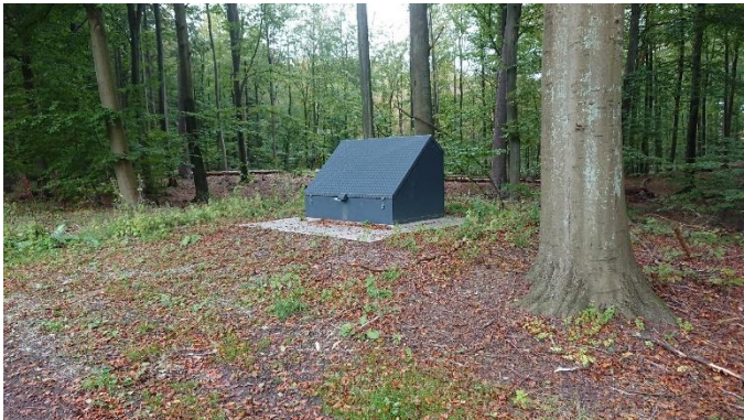
Eksempel på en råvandsstation, som placeres ovenpå boringen.

Det ansøgte er beliggende i landzone. Det ansøgte omfatter to råvandsboring med dertilhørende råvandsstation i en mørkegrøn farve, hvor den ene råvandsboring er placeret inden for fortidsmindebeskyttelseslinjen. Råvandsstationen har et grundplan på 2,4 x 1,2 meter og en højde på 1,5 meter. Et eksempel på dette fremgår på nedenstående billede.