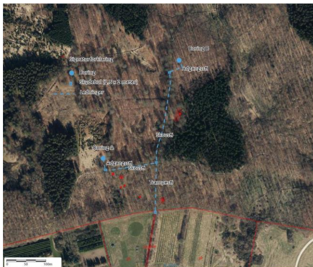
Skitse af borerne, adgangssti samt skydehul.

Efter borearbejdet mv. etableres ledningsforbindelser dybere end 1,5 meter under terræn ved horisontalt retningsstyrende underboring. Ledninger bores fra skydehul til skydehul (markeret på nedenstående kort). Der vil ydermere blive etableret to meter bred adgangssti af grus til borerne (markeret på nedenstående kort).